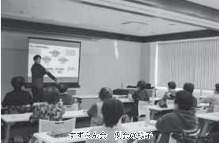
すずらん会 例会の様子