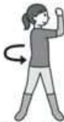
(2) 足の裏は地面に付けたまま腰をねじってみましょう。その後、正面に戻ります。