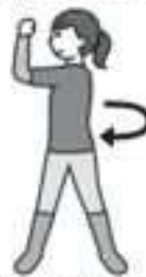
(4) 真横の景色を見るようなつもりで、腰をねじってみましょう。

7つの部位を使った 体操プログラム 「THERMOS」 「サ・タイソウ」はコチラ