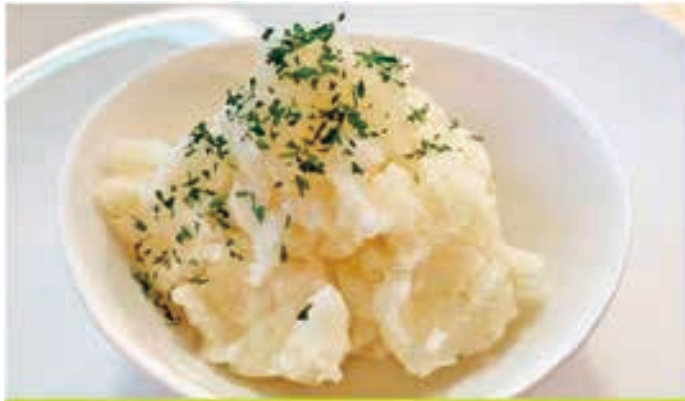
北海道「こっくりミルク」のポテトサラダ