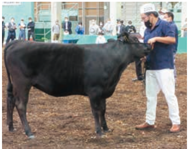
20部 1等2席 若雌一の部 優秀賞 侷福澤農場 出品牛 ちかも