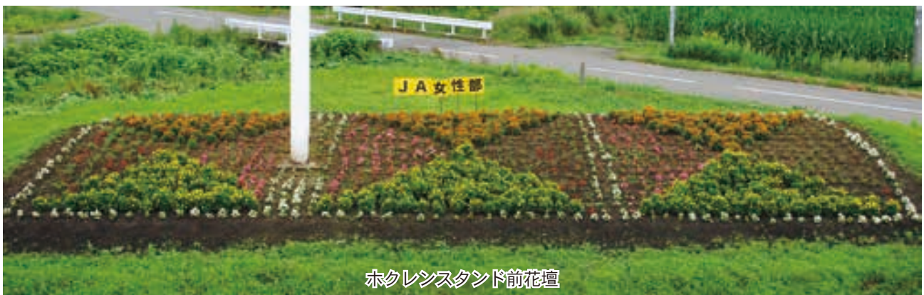
ホクレンスタンド前花壇

らではの活き活きとした生活空間を大切に、花を通して心の豊かさを深めるため毎年実施しており、町の環境整備の一環として事業費の一部助成を受けている。 今年は、七月に降った雹の影響で花が一部枯れてしまったが、花壇の草取り、給水等を各支部の当番制により管理していく。