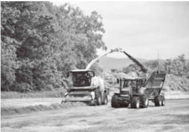
自走式ハーバスターによる収穫作業

今後もコントラクター事業では消化液散布、堆肥散布、二番牧草収穫、デントコーン収穫、ビート・大豆収穫等を実施していくが、昨今の働き方改革及び、天候不順といった情勢を踏まえ、今後もより作業効率を高めるためにも利用者の事前準備等、益々のご理解、ご協力を賜ります様宜しく願い申し上げます。