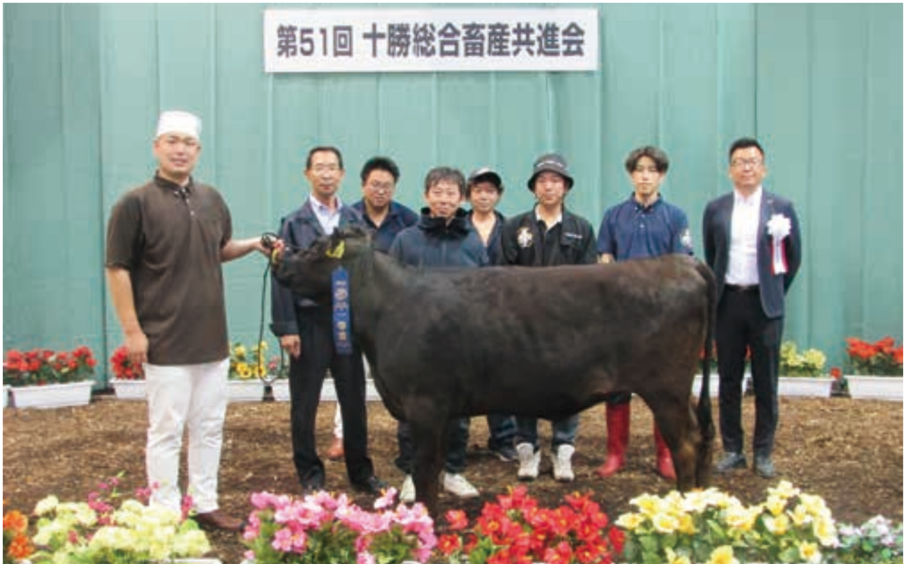
18部 1等1席 侷福澤農場 出品牛 ゆうか3