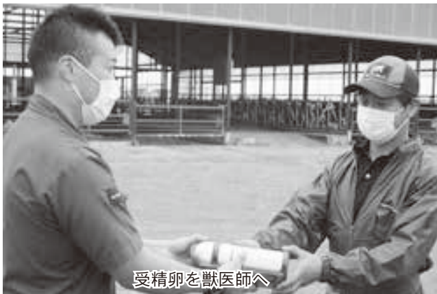
受精卵を獣医師へ

な影響を与えるかを調べ、季節や時間帯を変えて本年度中に計四回実験を行う。受精率向上による子牛の供給不足解消、輸送距離や時間の短縮によるコスト削減、冬季の配送リスク低減などが狙いである。 冷凍していない受精卵は衝撃に弱いため、機体が傾かず揺れないように開発された、物流専用のドローン（全長一・七メートル、幅一・五メートル）を使用。水筒に入れて温度を二十〜二十五度に保ち輸送された。 JA全農ET研究所から、片道七・一キロ先の熊谷牧場に約十三分で輸送。到着後、獣医師に手渡しして損傷の有無などを確認した後、乳牛に移植された。