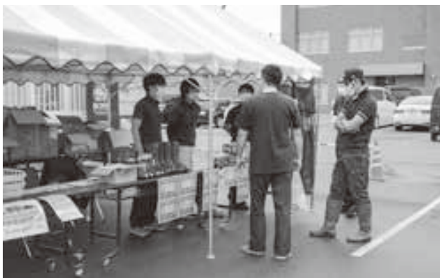
生産資材店舗前 販売促進会の様子

収穫期前の部品展示即売会が8月9日～10日の2日間、農協の生産資材課店舗前にて開催された。ツナギやトアスプレー・特価長靴等多数用意され、お得になった商品や農作業に向けた消耗品を買い求め、賑わいを見せた展示会となった。