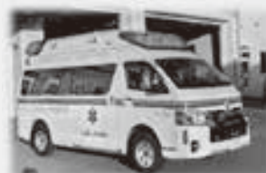
(写真は、昨年度実績です)

今後も行政とJAとの連携を図りながら、組合員ならびに地域住民に安全・安心を提供し続けるよう努力してまいります。