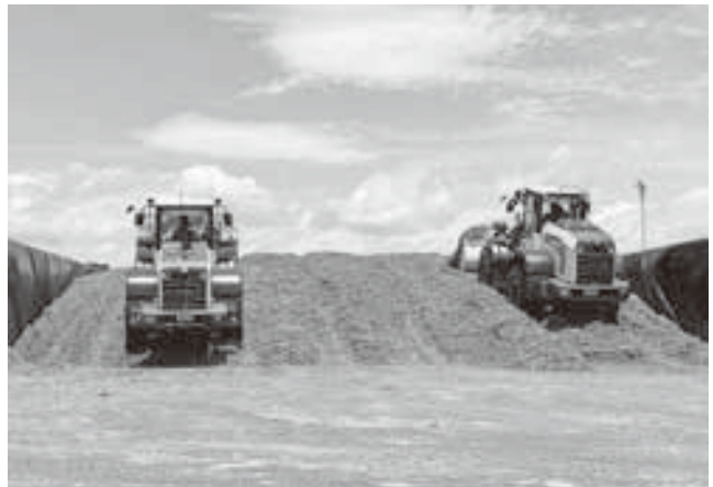
TMRセンター原料受入