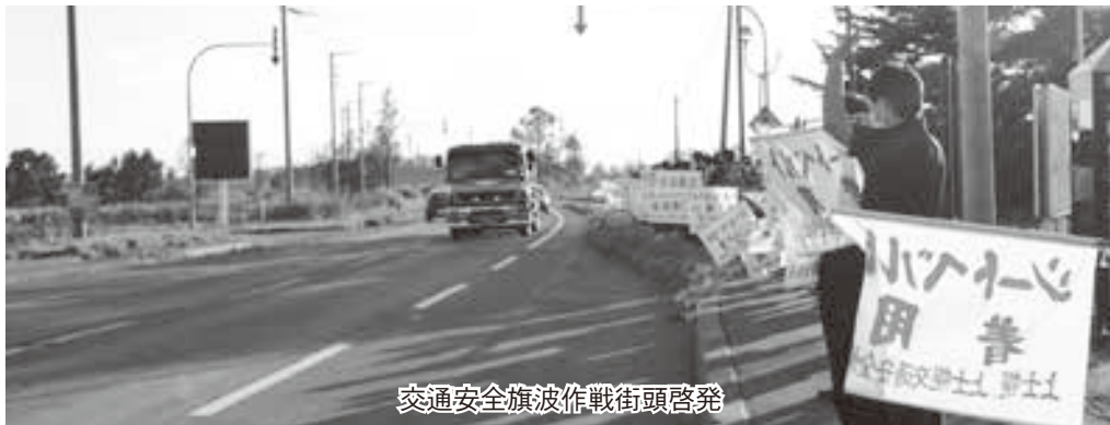
交通安全旗波作戦街頭啓発