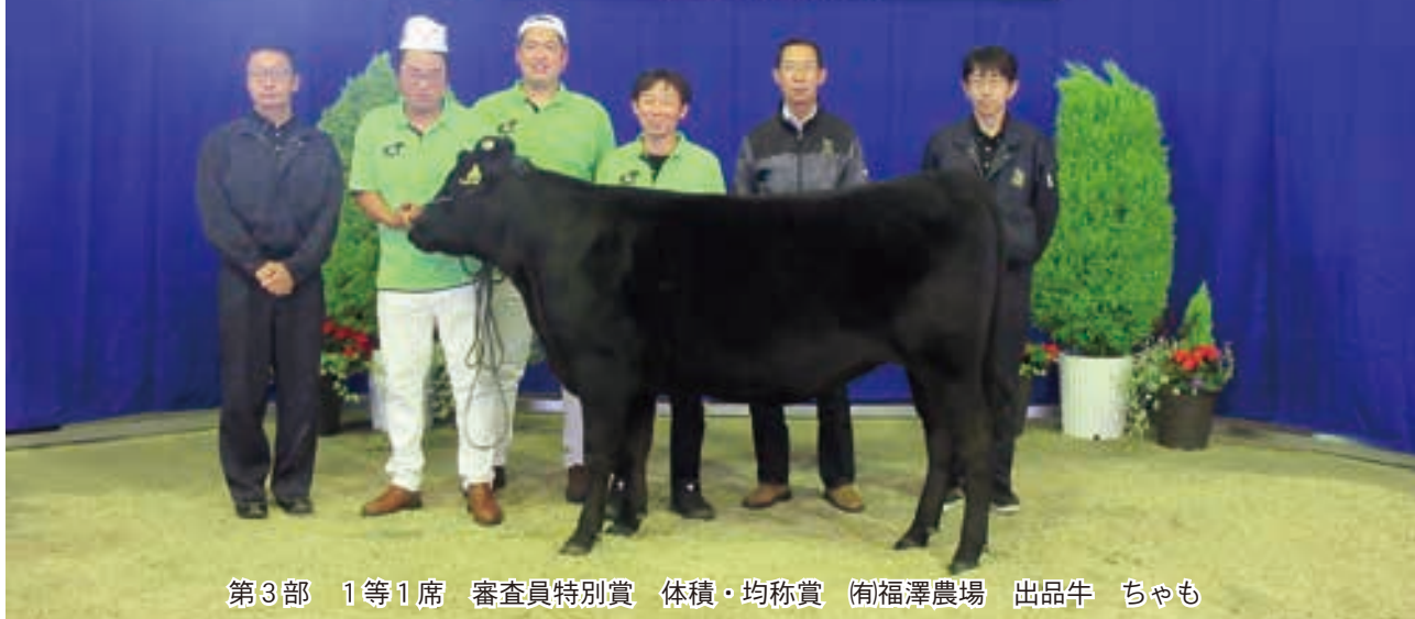
第3部 1等1席 審査員特別賞 体積・均称賞 (有)福澤農場 出品牛 ちゃも