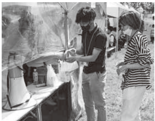
酪農課によるピザ販売