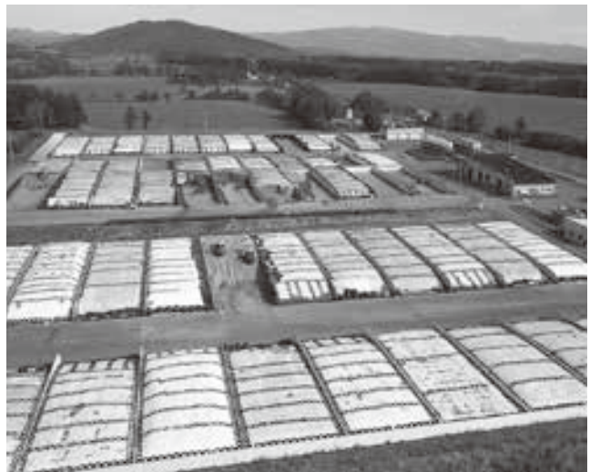
TMRセンター原料受入作業