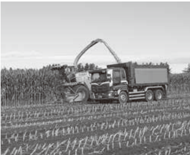
ハーベスタ収穫作業

上士幌町農協コントラクター事業のデントコーン収穫作業が九月八日から行われた。期間中は利用者、関係業者の協力もあつたことと、今年度についても台風による倒伏圃場が殆どなかったことから作業も順調に進み、無事に十月六日に全ての作業が終了した。 今年度の収穫面積約千四百七十ha、利用戸数は四十三戸（TMRセンター利用者含む）だった。また、収量、品質について、実の登熟は例年より早く高栄養化に期待できるものの収量については生育時期の多雨が大きく影響し、背丈は低く収量は総じてここ数年と比較し、少ない傾向となった。 デントコーン収穫後もコントラクター事業では各作業を進めて参りますが堆肥の異物混入の防止や圃場内の障害物の撤去等、利用者のご理解・ご協力を賜ります様宜しくお願い致します。