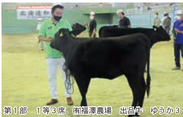
第1部 1等3席 (有)福澤農場 出品牛 ゆうか3