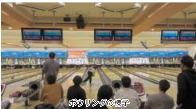
ボウリングの様子

スポーツ交流会後市内にて懇親会が行われ、スポーツ交流会にて入賞した部員へ賞品が手渡された。その後、部員同士交流を深めるなど非常に楽しい時間を過ごした。