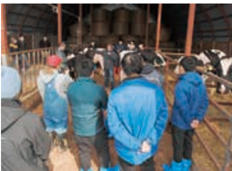
バーンミーティング様子

た場合、どちらのリードマンがうまく牛を操っているかで決まります。」また、「牛をリングで良くみせるためには、牧場で十分な調教をするかがとても大切です。」と説明した。