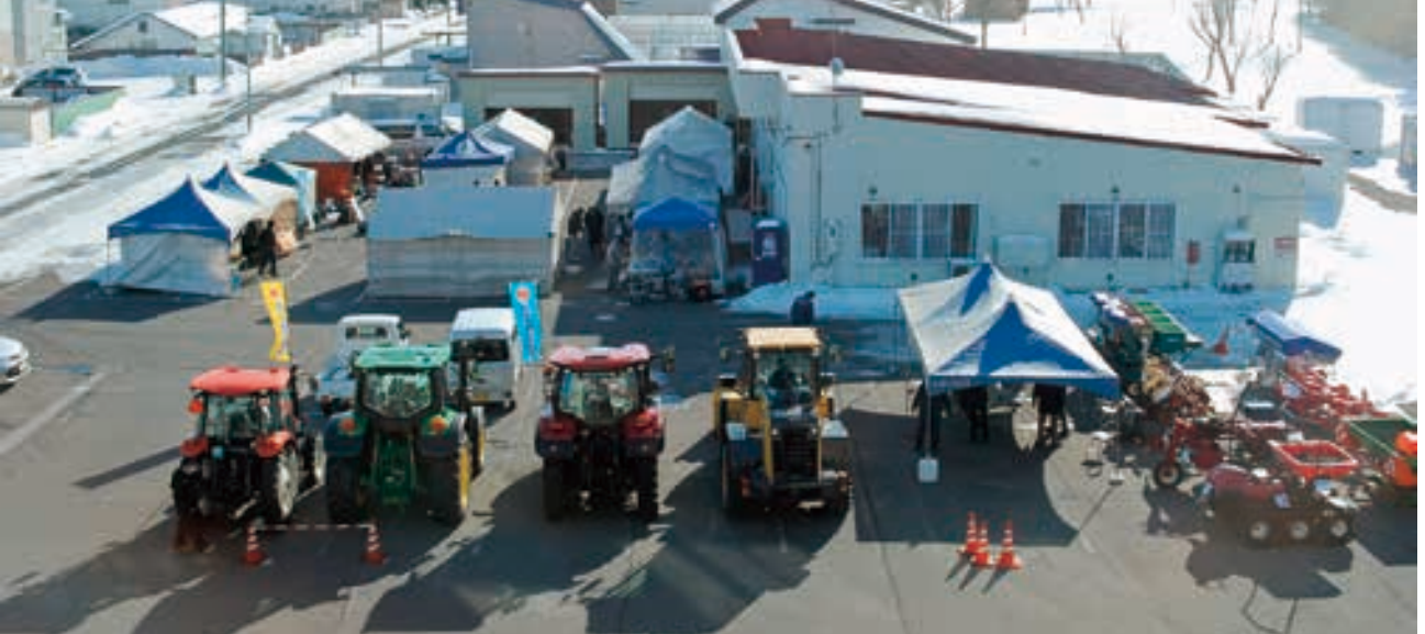
農機部品展示会の様子

2月16日～17日の2日間で農協の生産資材店舗前にて部品展示会がメーカー協力のもと開催された。部品等が展示され実際に商品を手に取り、春から開始される農作業に向けて各種部品等を買揃えていた。メーカー販売担当者からの機能説明や意見交換が行われ、賑わいを見せた展示会となった。