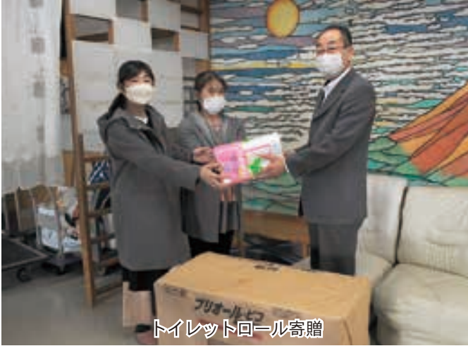
トイレトロール寄贈

今年度もJA女性部の重点目標に掲げ、Aコープルピナの協力のもと、紙パック回収運動を展開する。