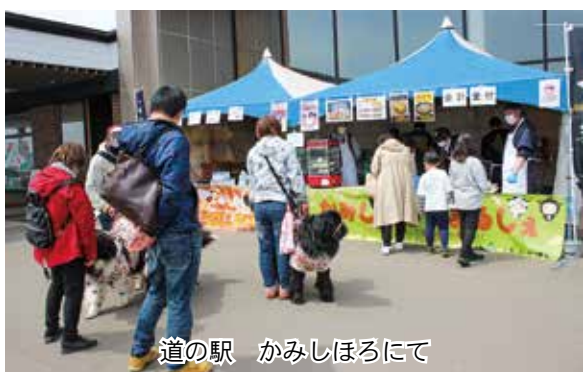
道の駅 かみしほろにて

四月二十九日、三十日の二日間、「道の駅かみしほろ」にて、屋外テントを張り、農畜産物の消費拡大運動を行った。 特産品の「十勝ナイタイ和牛」や地元産のあんこを使ったピザ、あんこ・ごぼう味の「ほろんまん」・豆缶・甘納豆・あんこ・羊羹などを販売。 その場で、ナイタイ和牛やあんこ、チーズなどをピザ生地にとッピングし、石窯で焼き上げ出来たてを提供した。