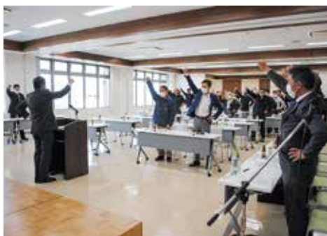
がんばろう唱和の様子