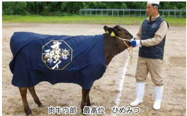
肉牛の部 最高位 ひめみつ