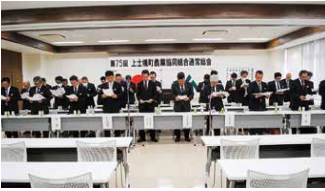
J A 綱領朗唱様子