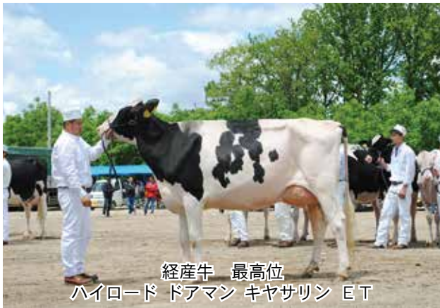
経産牛 最高位 ハイロード ドアマン キヤサリン ET