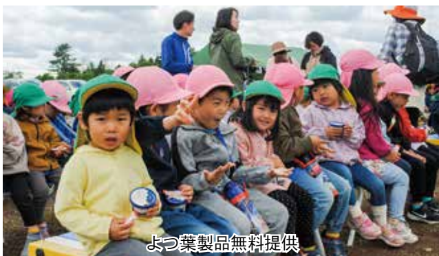
よつ葉製品無料提供