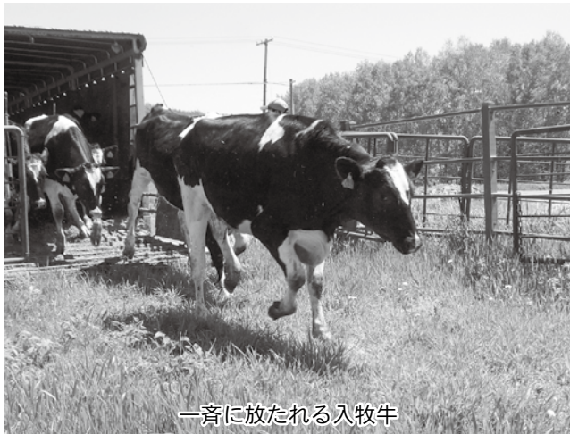
一斉に放たれる入牧牛