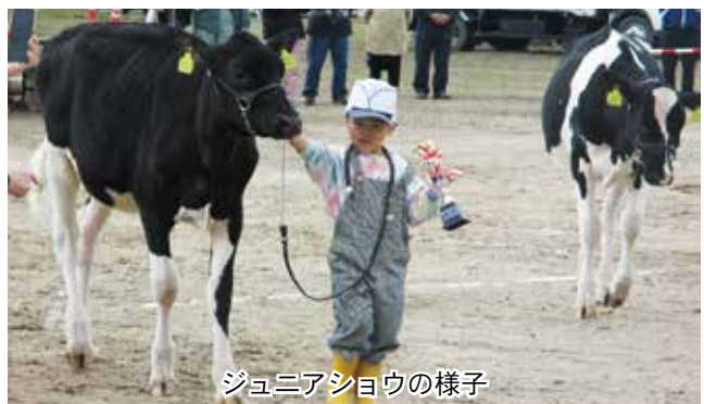
ジュニアシヨウの様子