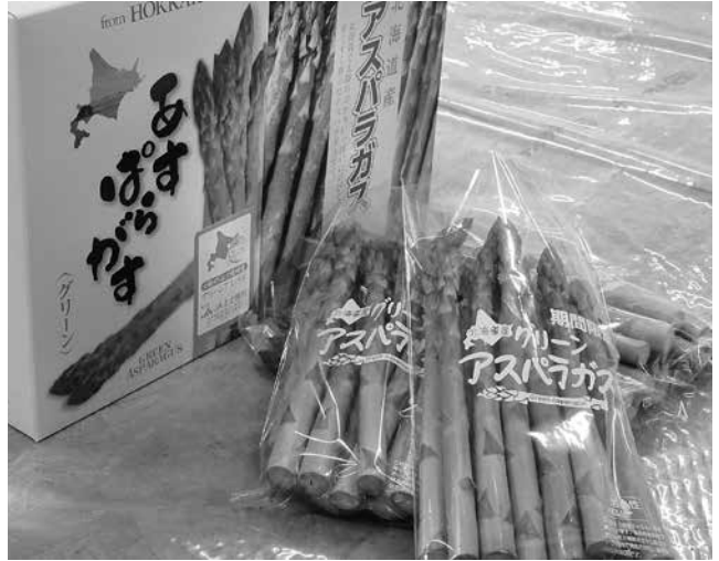
一本一本丁寧に選果され、出荷されるアスパラガス