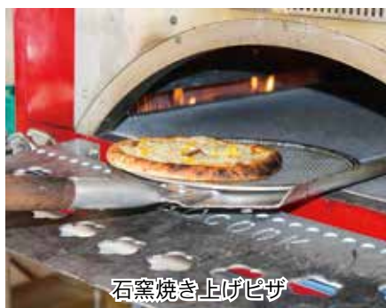
石窯焼き上げピザ

購入者には特選北海道牛乳のプレゼントを行い、訪れた観光客や家族連れに喜ばれた。 今後上士幌町の特産品を使ってPRを行い、上士幌町の農畜産物の消費拡大に繋げていきたい。