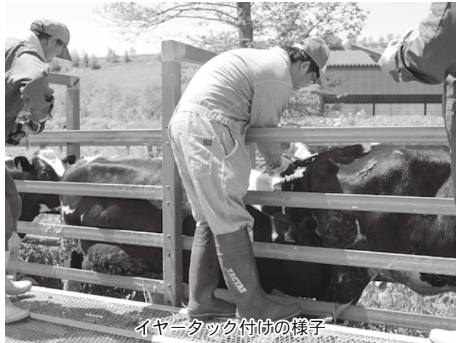
イヤータック付けの様子

5月中旬、ナイタイ高原牧場において今年度の放牧が開始された。各利用者の預託牛は日本一の広さを誇る大草原に勢いよく駆け出していく。