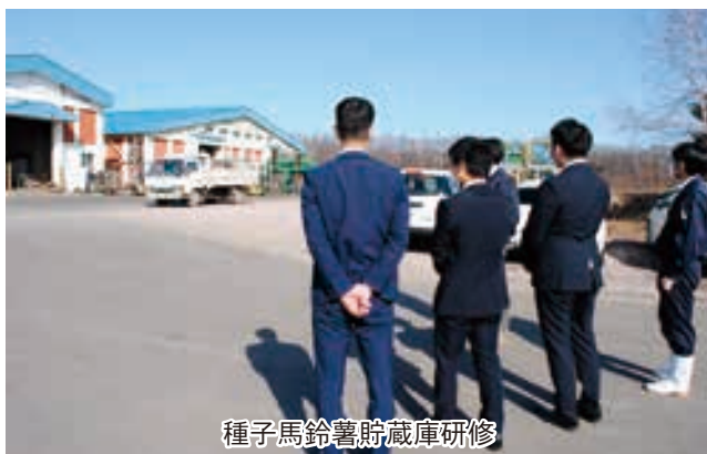
種子馬鈴薯貯蔵庫研修