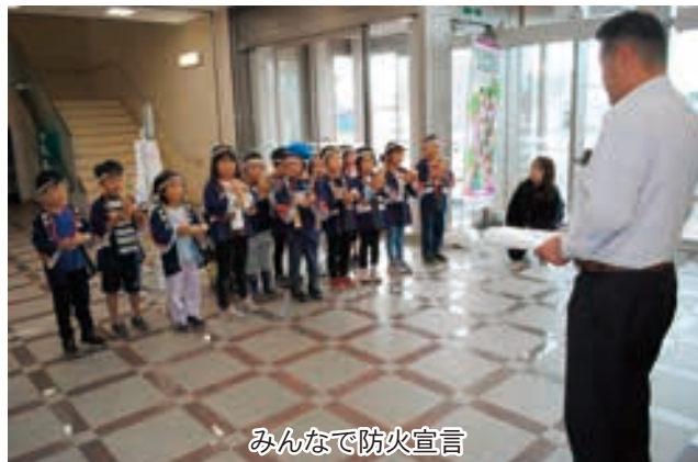
みんなで防火宣言