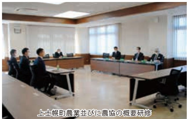
上士幌町農業並びに農協の概要研修