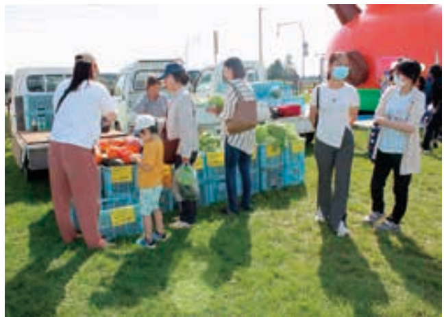
安価な地場産野菜