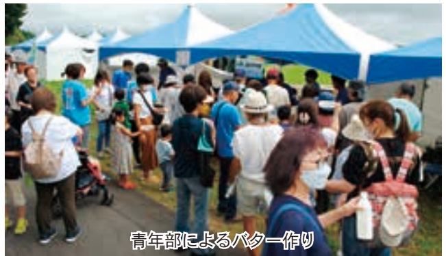
青年部によるバター作り