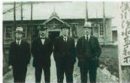
十勝川治水事務所（昭和2年頃）

そこで、開拓の中心地域である茂岩から西帯広までの延長56kmにも及ぶ区間に堤防、新水路掘削、護岸工事を実施するための計画が立てられました。大正12年、十勝川治水事務所が開設（現在の帯広市大通南1丁目）され、本格的な治水事業が開始されました。