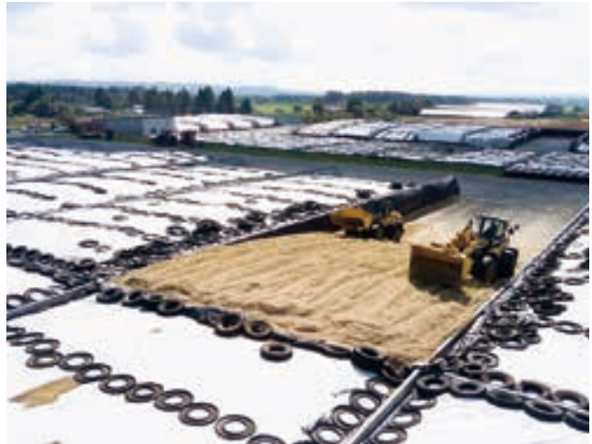
TMRセンター原料受入作業