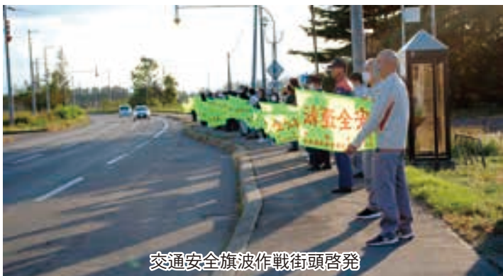
交通安全旗波作戦街頭啓発

秋の全国交通安全運動が令和五年九月二十一日より全国一斉でスタートしたのに合わせ、上士幌町交通安全協会主催による「交通安全旗波作戦街頭啓発」が、十月二日国道二四一号沿いのサトウ機工西側用地で開催された。