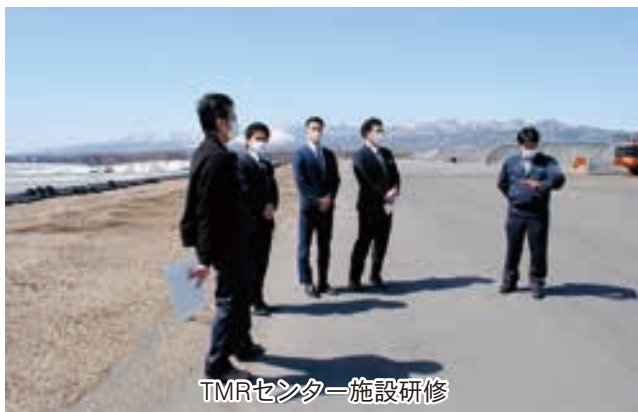
TMRセンター施設研修