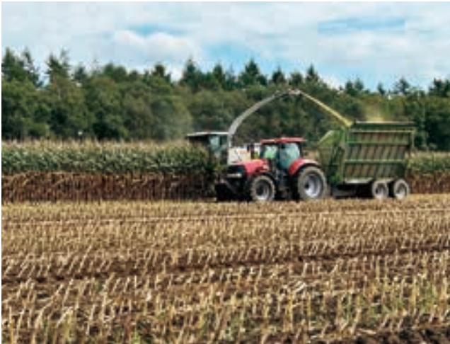
ハーベスタ収穫作業

上士幌町農協コントラクター事業のデントコーン収穫作業が九月七日から行われた。期間中は利用者、関係業者の協力もあつたことと、今年度についても台風等による倒伏被害が殆どなく、作業時は降雨による中断もあつたが、利用者、関係者の協力もあり、無事に十月二日に全ての作業が終了した。 今年度の収穫面積約千四百五十ha、利用戸数は四十一戸（TMRセンター利用者含む）だった。品質についてはデントコーンそのものの仕上がりが例年より十日から二週間程早く一部根腐れ病や煤紋病の被害を受けた圃場もあつたが、実の登熟が進んでいたこともあり、高栄養化が期待できる。収量については、総じて例年並みを確保できた。 デントコーン収穫後もコントラ事業では各作業を進めて参りますが堆肥の異物混入の防止や圃場内の障害物の撤去等、利用者のご理解・ご協力を賜ります様宜しくお願い致します。