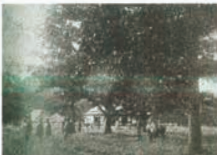
明治30年頃の然別村 渡辺牧場*

一方で、明治35年冷害暴風による凶作、明治40年豪雨冠水といった災害が続き、治水事業と並行して農業基盤整備が必要になってきました。大正期に音更川、士幌川でかんがい溝工事、昭和38年に士幌新橋下流に十勝頭首工が完成しました。こうした河川の安定化と土地改良の成果は、十勝有数の酪農富産、畑作地帯を形作って現在に至ります。