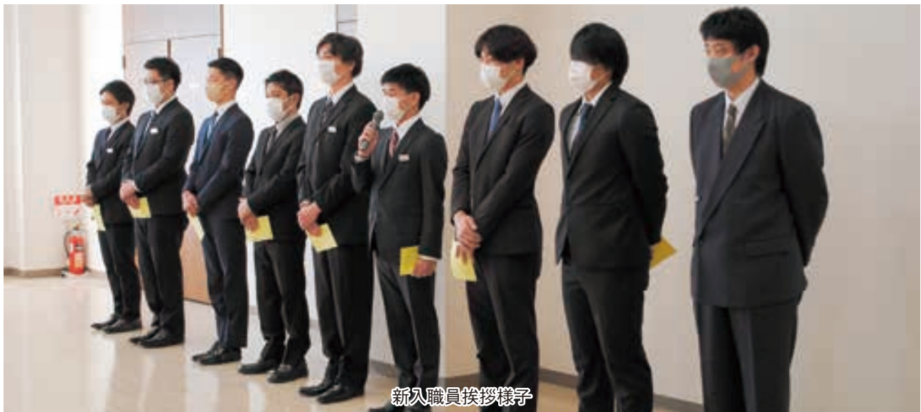
新入職員挨拶様子