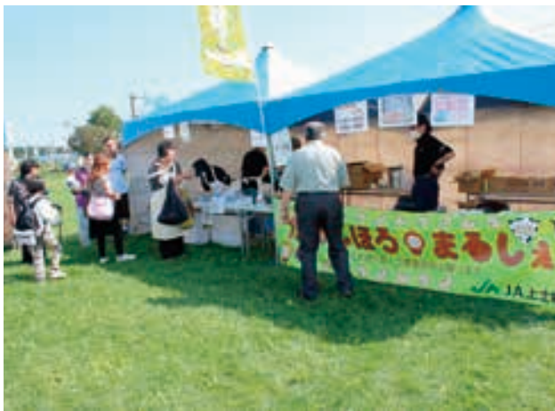
豆缶、ようかんなどの販売

農商工生涯学習まつりが十月一日に道の駅かみしほろで開催され、地場産の野菜等が安価で販売された。 当日は、好天に恵まれ、祭り日和となった。大勢の来場者が足を運び、両手いっぱい農産物を買って求めていた。 J Aからは農畜産物の消費拡大を目的に畜産部によるクレープ販売や、農産部による豆缶や羊羹などの加工品の販売が行われた。購入者にはよつ葉特選北海道牛乳のプレゼントを行い、訪れた来場者や家族連れに喜ばれた。 豪華景品が当たるお楽しみ抽選会も行われ、来場者は楽しい一日を過ごした。