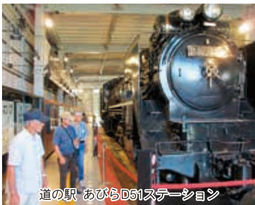
道の駅 あびらD51ステーション

ナショナルセンターとなっており、国立アイヌ民族博物館ではアイヌ文化に係るものの展示を見学し、広場でムックリの演奏を聴いている方々の姿も見られた。その後体験交流ホールに移動し北海道の大自然がプロジェクトンにて映し出される中、アイヌの伝統的な歌や踊りを見学し、美しい映像や歌や踊りに感銘を受けた。続いて昼食会場であるグランテラス千歳に到着し、お弁当を食べ最後の目的地である道の駅あびらD51ステーションへと向かった。到着後は鉄道資料館にて蒸気機関車D51 320号機の見学、お土産や農産物直売所で新鮮な野菜などをたくさん買い、この旅行最後の買い物を楽しんだ。道中、占冠PAにてト