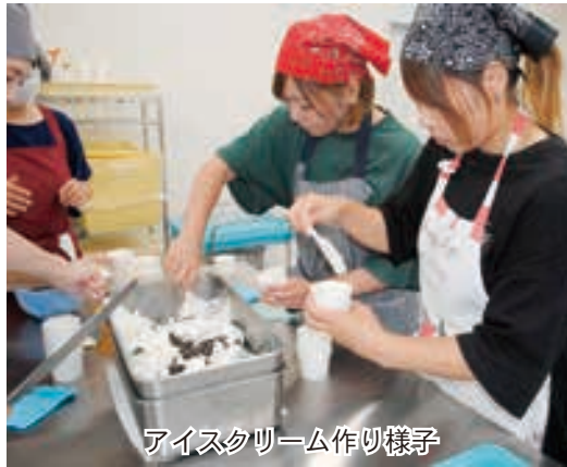
アイスクリーム作り様子

は終始笑顔で部員同士の親睦が深まった研修となった。出来上がったアイスクリームとベーコンは参加者で分けて解散となった。