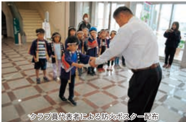
クラブ員代表者による防火ポスター配布

J A上士幌町にも10月6日、クラブ員約20名がお揃いの法被姿で訪問した。元気よく防火・防災を取り組む事を宣言し秋の火災予防を促した。