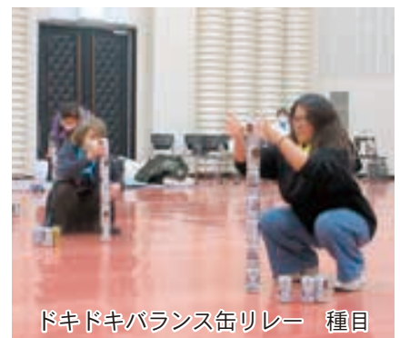
ドキドキバランス缶リレー 種目