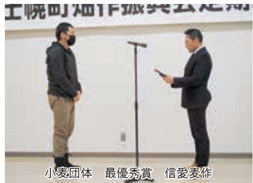
小麦団体 最優秀賞 信愛麦作