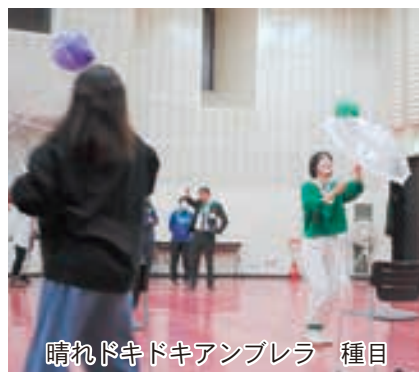
晴れドキドキアンブレラ 種目